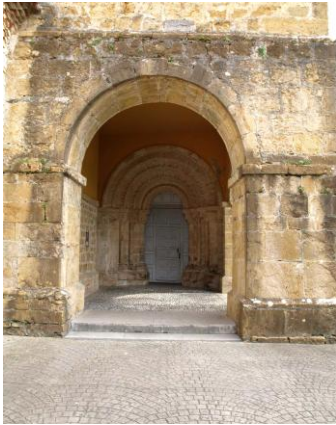
Autor Fotografía: Daniel Herrera / Jesús I. Jiménez-05/2012