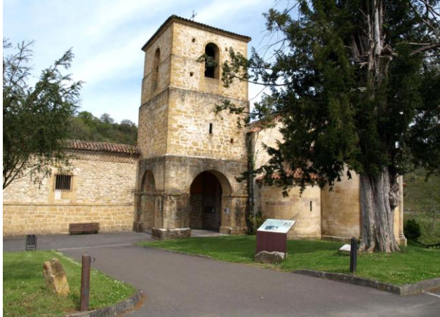
Autor Fotografía: Daniel Herrera / Jesús I. Jiménez-05/2012