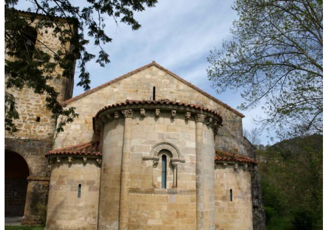
Autor Fotografía: Daniel Herrera / Jesús I. Jiménez-05/2012