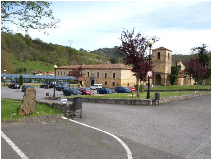
Autor Fotografía: Daniel Herrera / Jesús I. Jiménez-05/2012