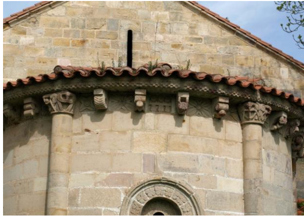
Autor Fotografía: Daniel Herrera / Jesús I. Jiménez-05/2012