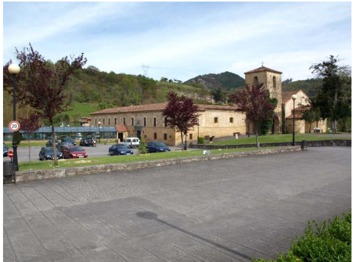
Autor Fotografía: Daniel Herrera / Jesús I. Jiménez-05/2012