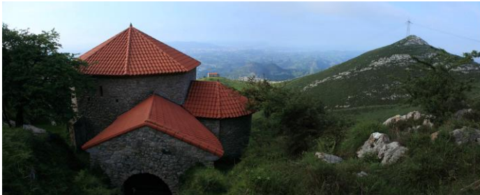
Autor Fotografía: Víctor M. Fernández Salinas-05/2011