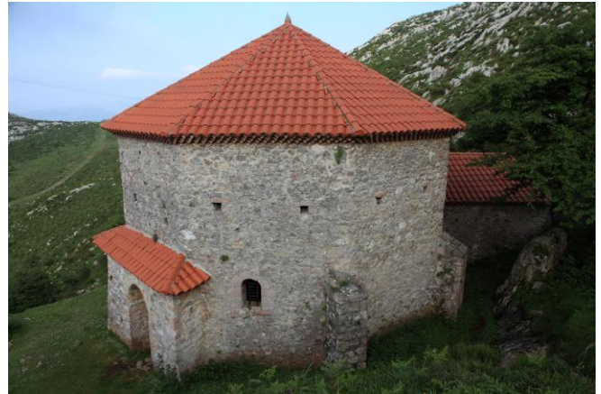
Autor Fotografía: Víctor M. Fernández Salinas-05/2011