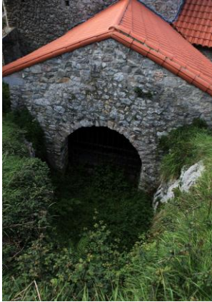
Autor Fotografía: Víctor M. Fernández Salinas-05/2011