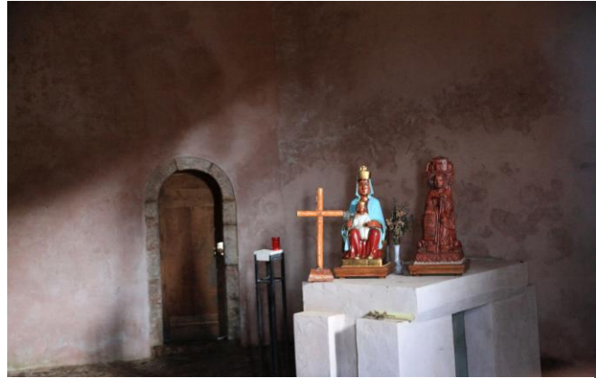
Autor Fotografía: Víctor M. Fernández Salinas-05/2011