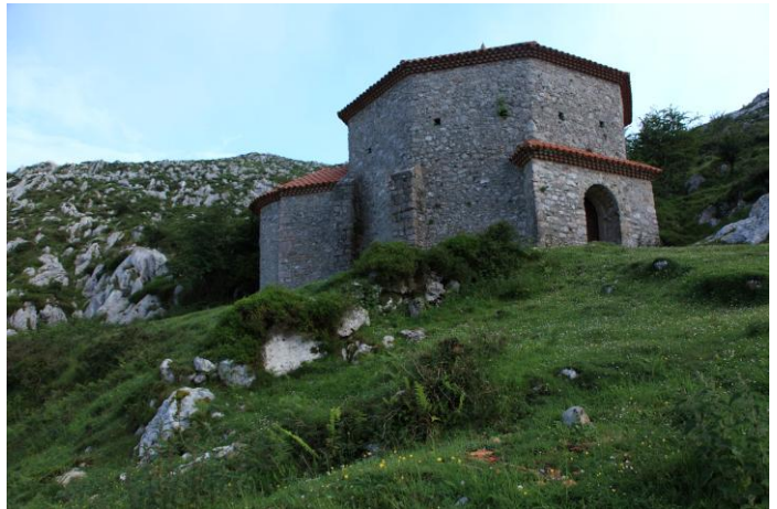
Autor Fotografía: Víctor M. Fernández Salinas-05/2011