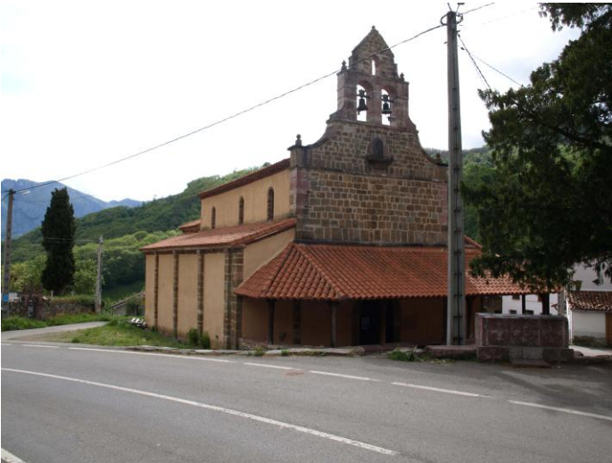
Autor Fotografía: Daniel Herrera / Jesús I. Jiménez-05/2012