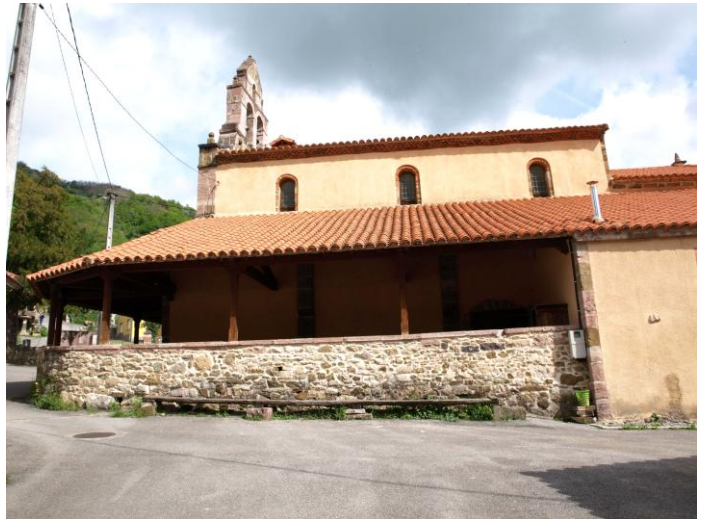
Autor Fotografía: Daniel Herrera / Jesús I. Jiménez-05/2012