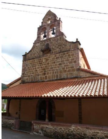
Autor Fotografía: Daniel Herrera / Jesús I. Jiménez-05/2012