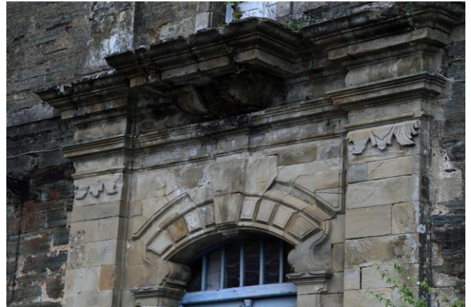
Autor Fotografía: Víctor M. Fernández Salinas-05/2011