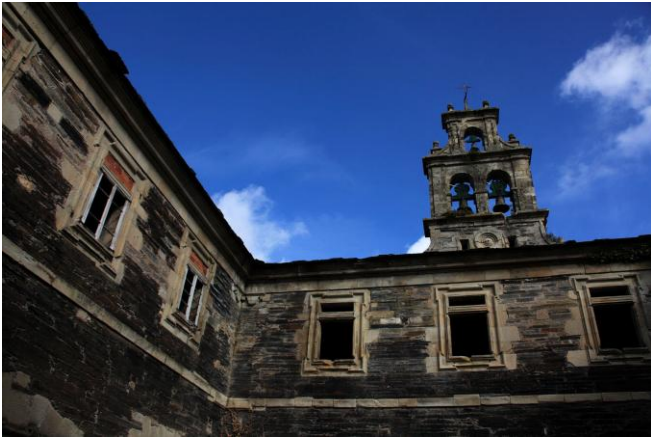
Autor Fotografía: Víctor M. Fernández Salinas-05/2011