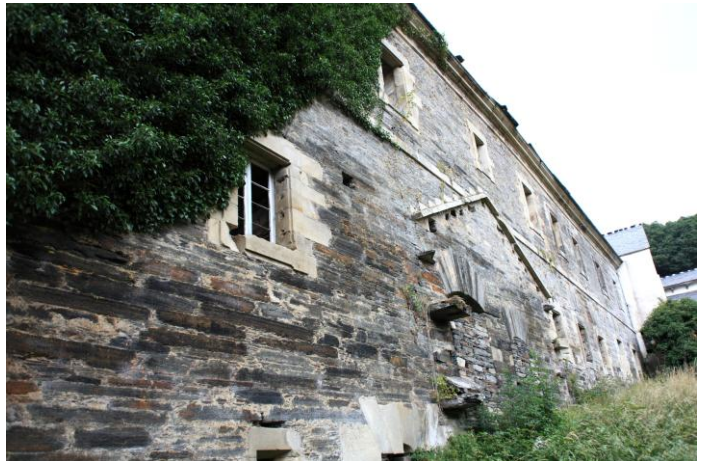
Autor Fotografía: Víctor M. Fernández Salinas-05/2011