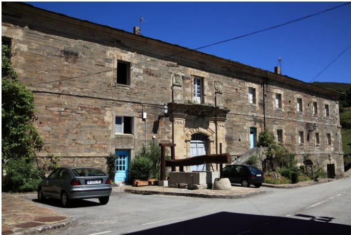
Autor Fotografía: Víctor M. Fernández Salinas-05/2011