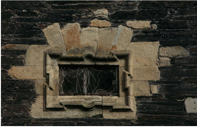
Autor Fotografía: Víctor M. Fernández Salinas-05/2011