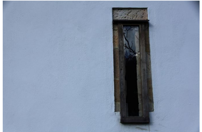
Autor Fotografía: Víctor M. Fernández Salinas-03/2011