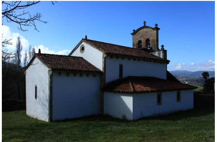
Autor Fotografía: Víctor M. Fernández Salinas-03/2011