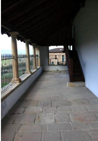
Autor Fotografía: Víctor M. Fernández Salinas-03/2011