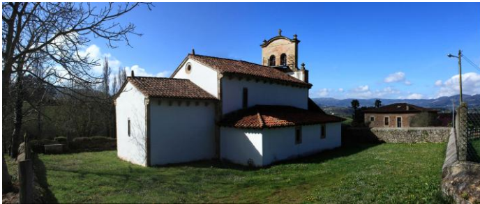
Autor Fotografía: Víctor M. Fernández Salinas-03/2011