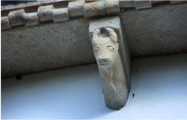
Autor Fotografía: Víctor M. Fernández Salinas-03/2011